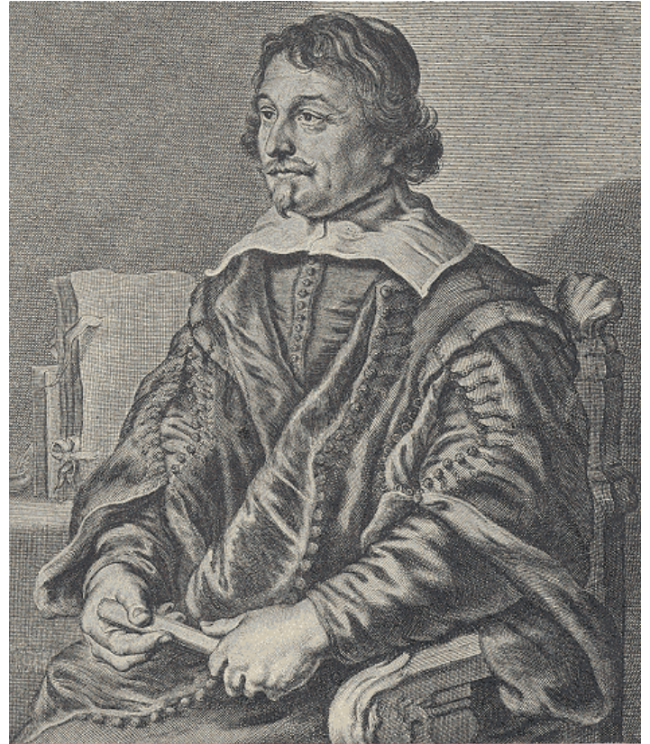
Joost van den Vondel.

Als we de vaderlandse en wereldgeschiedenis de revue laten passeren, blijkt dat er in al die eeuwen heel veel is gebeurd. Dat dit uren dagen maanden en zelfs jaren heeft gekost om te komen waar we nu zijn. En waarin de leus "Tijd is geld" heel wat opgeld opdoet. De intentie is dezelfde als vele eeuwen geleden, maar we zeggen het nu 'kort en krachtig'.